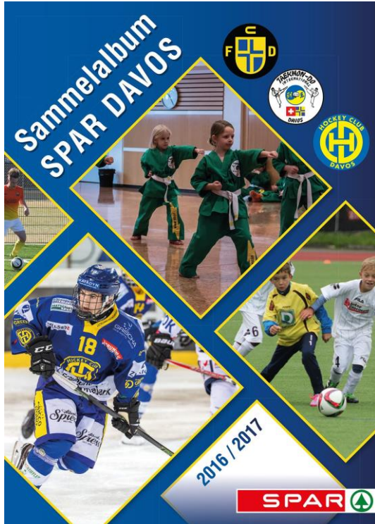
In den beiden SPAR Märkten Davos Dorf und Davos Platz gibt es bei Einkäufen Stickerbilder vom FC Davos, HC Davos und Teakwon-Do